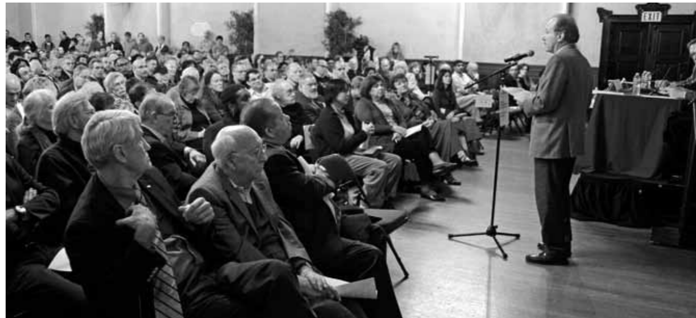
Møte i The Berkeley Academic Senate i november. Temaet var fordømmelse av universitetets ledelse for å ha tillatt politivold mot demonstrantene.

Det var en varm politisk høst i Berkeley. Den første dagen på campus ble jeg møtt av to store demonstrasjoner, begge rettet mot forslag om å endre på kvoteringsordninger utfra kjønn og rase i Californias høyere utdanning. Den ene demonstrasjonen var arrangert av studenter fra det republikanske partiet som illustrerte hva de oppfattet som urettferdig forskjellsbehandling