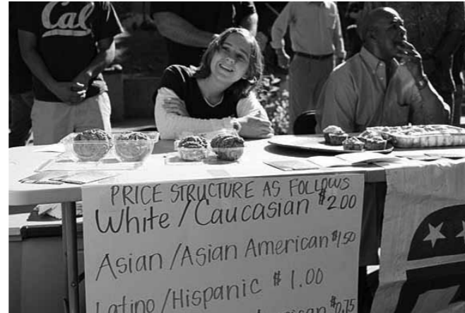
Studenter som demonstrerer ved å selge kaker til ulike priser avhengig av kjønn og hudfarge (dyrest for hvite menn).

I tillegg til å være et sted hvor det skjer mye faglig er Berkeley som kjent et helt vidunderlig sted å bare være. Da ser jeg bort fra de små jordskjelvene som med jevne mellomrom får husene til å riste. Det er utrolig vakkert, klimaet er helt topp, turmulighetene uendelige, og det er kafeer, lunsjsteder og bokhandlere overalt. San Francisco ligger 20 minutter unna med t-banen. Man kan se årgangsfilm hver kveld på campus, og medlemskap av Berkeley Recreational Center gir adgang til ikke mindre enn fire utendørs svømmehaller på, eller i nærheten av campus, i tillegg til alle de yogaklasser og andre fysiske aktiviteter man kan ønske seg. Biblioteket - med mange avdelinger på de ulike instituttene - er et eldorado, alltid med god plass, (nesten) alltid med de bøkene man leter etter og som alltid står på plass i hyllen. Min favoritt er The Morrison Library med dype skinnlenestoler med fotskamler, gulvtepper, varm belysning fra gamle glasslampeskjermere (ikke rart at en del studenter bruker sofaene til å sove i) og alle dagens aviser og tidsskrifter er fritt fram. At man kommer på nettet overalt med sin medbrakte PC, telefon eller iPad sier seg selv.