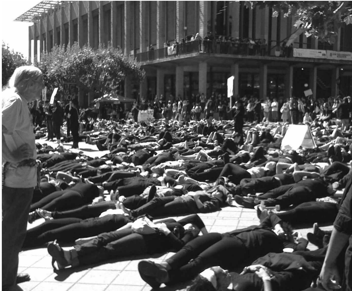
Fra demonstrasjonen på UC Berkeley hvor ca. 100 afro-amerikanske studenter, kledd i svart, lå utstrakt på bakken som om de var døde - som like etter et attentat. Demonstrasjonen var rettet mot forslag om å endre på kvoteringsordninger ut fra kjønn og rase i Californias høyere utdanning.