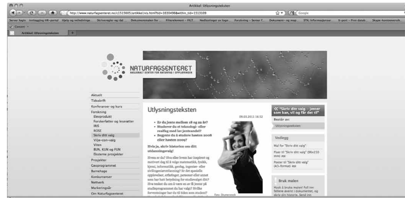
Sjermdump fra forskningsprosjektets nettside på www.naturfagsenteret.no/

Normer og verdier eksisterer blant annet i form av stereotype oppfatninger, eller diskursen jenter og realfag. En slik diskurs kan også forstås som en metahistorie, der følgende diskurser inngår; 1) mer eller mindre artikulerte forestillinger om jenter som kjønnskategori, 2) forestillinger