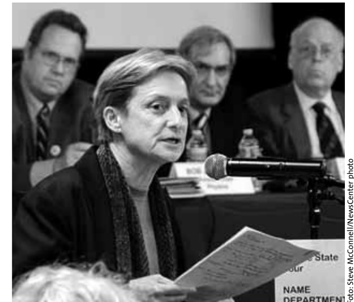
Judith Butler holder et skarpt innlegg i The Berkeley Academic Senate.

annet fag med kjønn - litt slik vi her på STK har organisert den nye mastergraden i tverrfaglige kjønnsstudier. I Berkeley undersøkte jeg også mulighetene for å få i stand en utvekslingsavtale mellom GWS og vårt masterprogram. Det viste seg at utveksling på dette nivået er mye enklere å få til enn utveksling på bachelor (BA) - og PhD-nivå. På BA-nivå er kursene lukket og PhD-studenter regnes som betalende studenter i USA. På MA-nivå, derimot, vil våre studenter kunne få en "concurrent enrollment" som vil gi dem rett til å