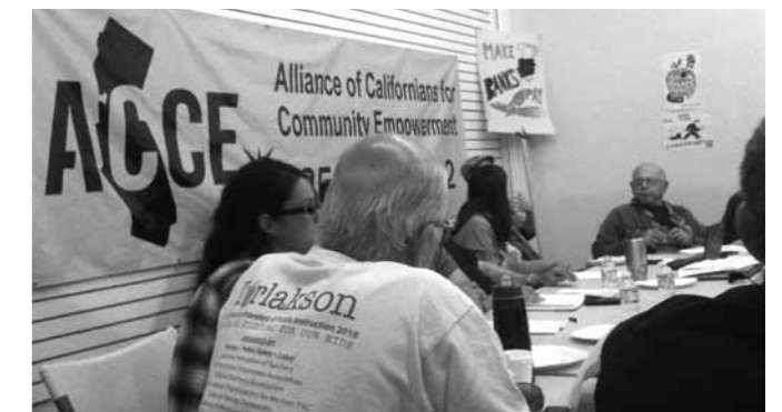
Møte i ACCE - Alliance of Californians for Community Empowerment.