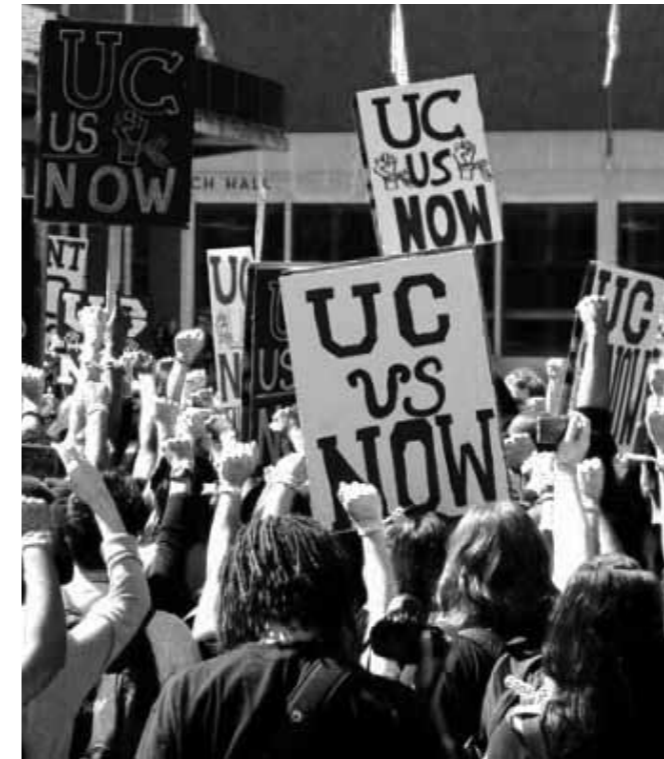
Afro-amerikanske studenter sto tause med plakater "UC us now".