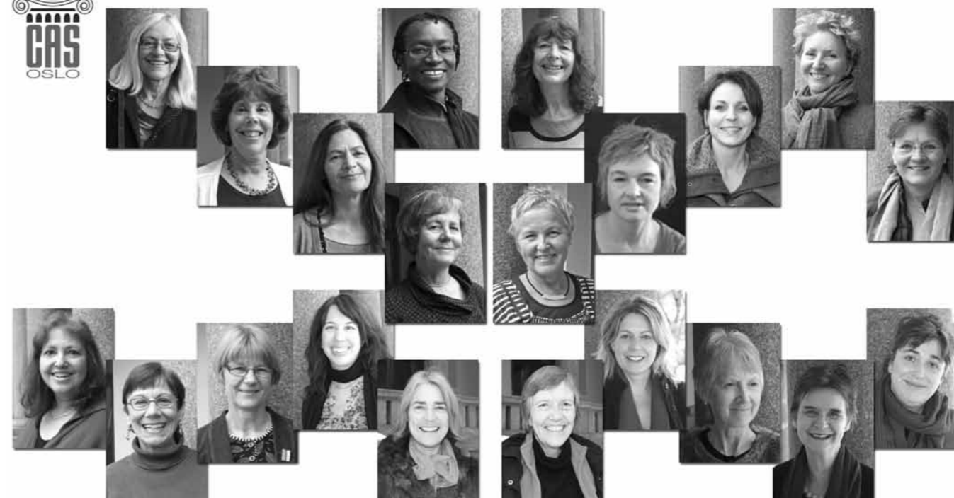
av alle deltakerne