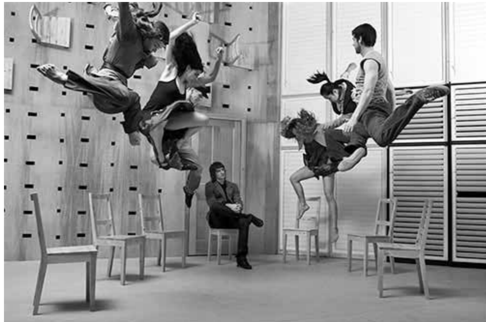
Jasmin Vardimon Company: 'Justitia'

Høstens konferanse Bodies in Motion. The Politics/Poetics of Movement and Stillness bød på en sjelden sjansje til å oppleve et bredt spekter av forskning på kropp i ett og samme arrangement. Kroppslig praksis sto side om side med teori, både i temaene som ble presentert og i typen presentasjoner.