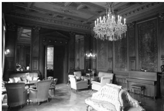
Vitenskapsakademiet i Oslo