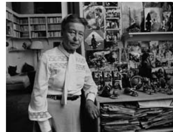
Simone de Beauvoir i sin leilighet i Paris, 1976.

Kjønn og dikotomier/motsetninger/forskjeller er sentrale temaer innenfor fagfeltet og noe jeg ønsket å undersøke i den hensikt å forstå prosesser mot endring. Hvordan kjønnsteori reflekterer praksis er også bakgrunn for oppgaven. Studier viser at både kvinner og menn (som grupper) har dårlige vilkår, men